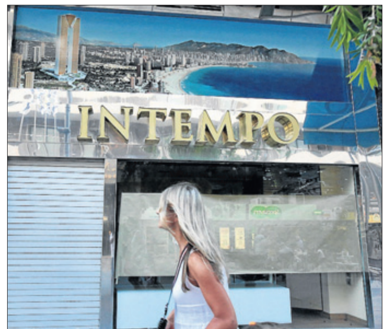
La inmobiliaria -ya cerrada- que vendía a particulares.